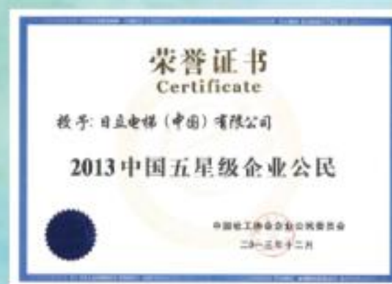
中国五星级优秀企业公民