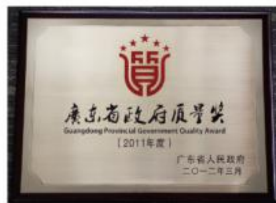
广东省政府质量奖