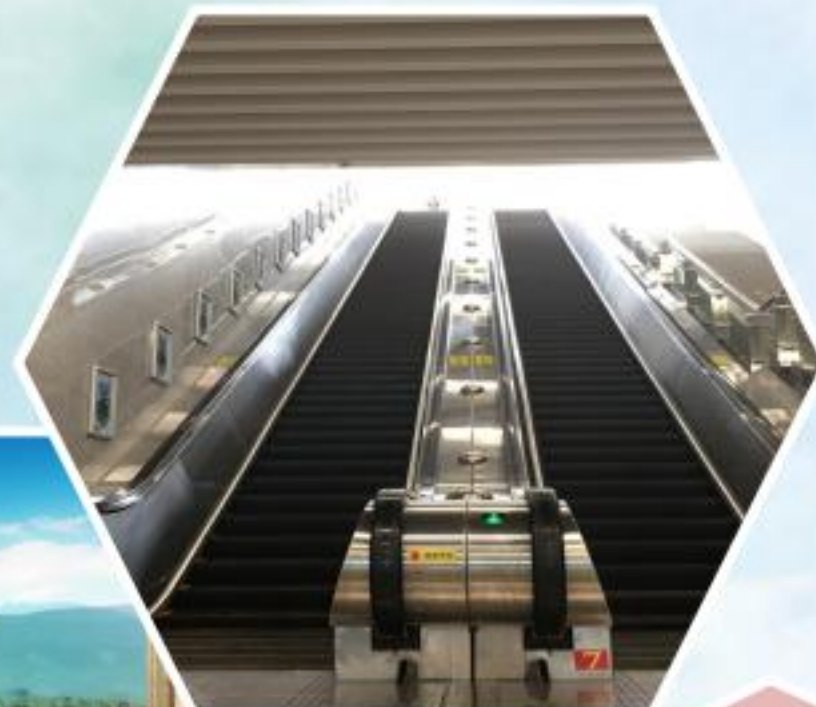
南宁地铁1号线 南宁地铁4号线