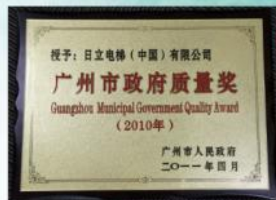
广州市政府质量奖