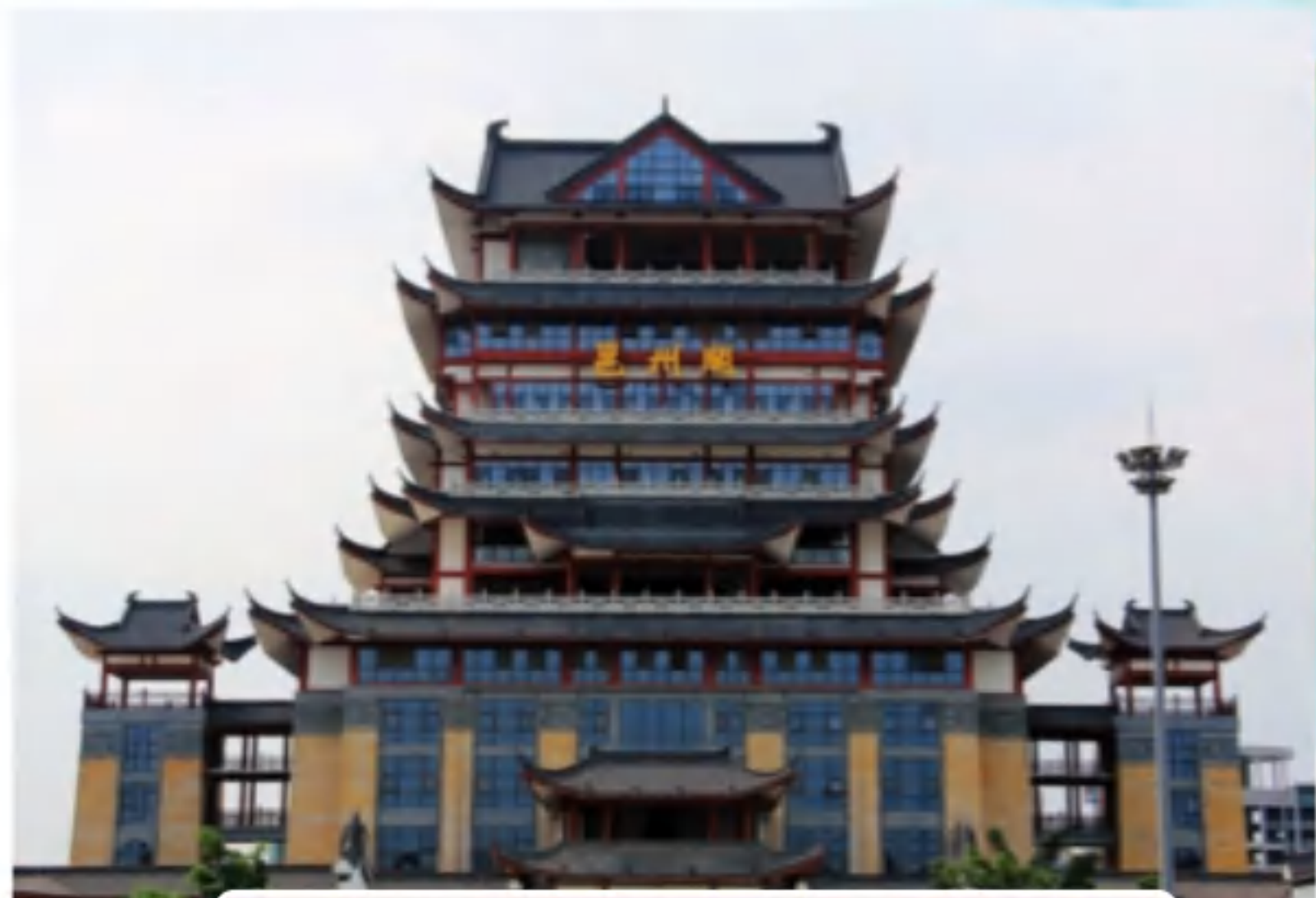
广西司地址——邕州阁

日立电梯（中国）有限公司广西分公司自2003年成立以来，公司在区内下辖的各地级市柳州、桂林、梧州、北海、玉林等设立了 二十多个售后服务站点 。作为 广西境内最大 的电梯产品销售、产品安装、维修保养以及技术咨询企业，秉承日立电梯“天天向上的追求”的核心理念，以卓越的品质和完善的服务在广西区内树立了优良的企业形象，赢得了市场和客户广泛的认同。