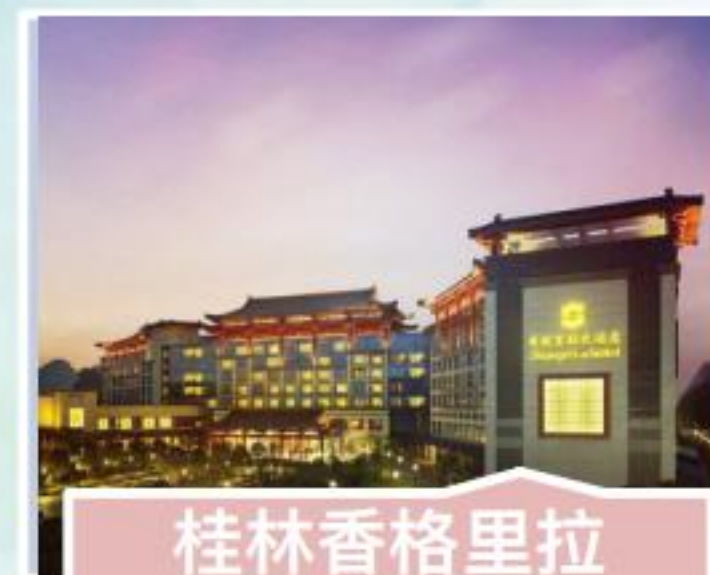
桂林香格里拉大酒店