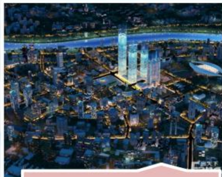
宝能环球金融中心