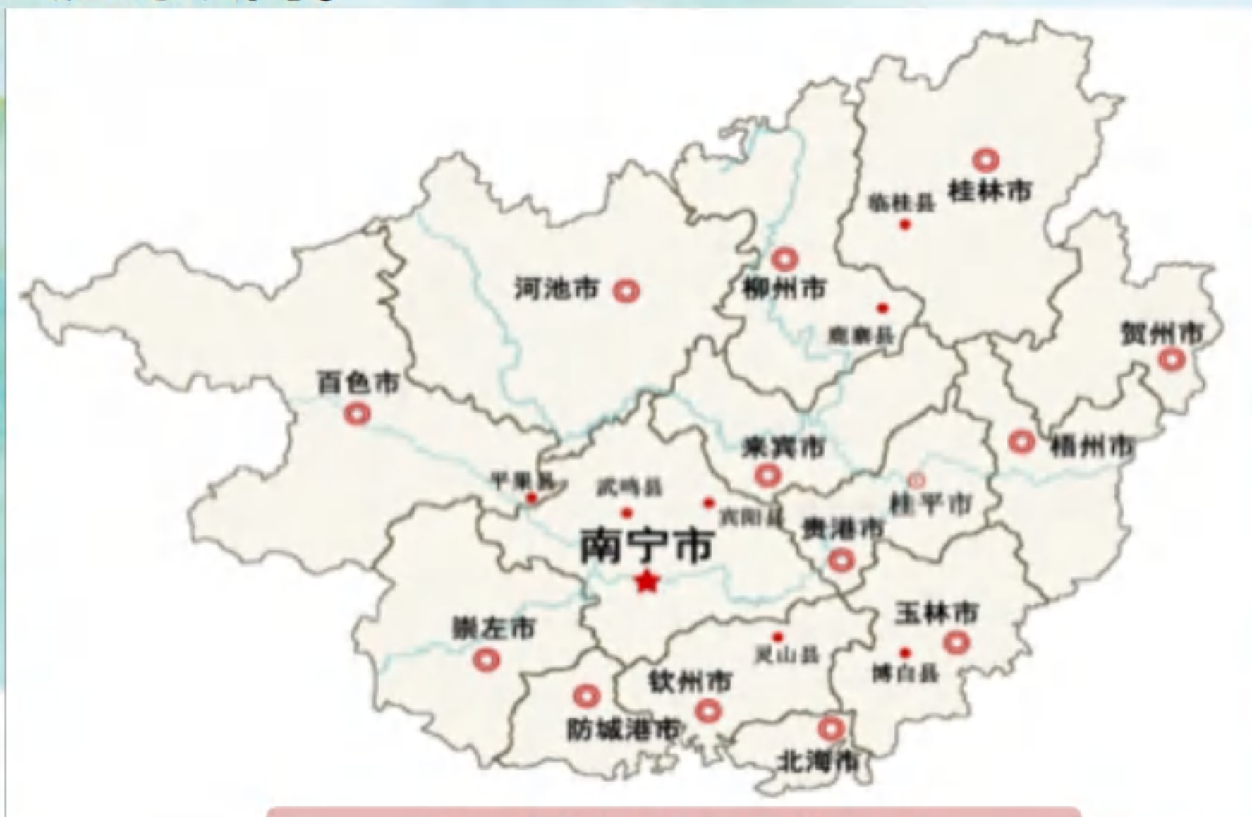
广西司维保站点分布图