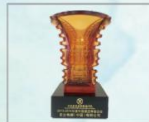
中国最受尊敬企业